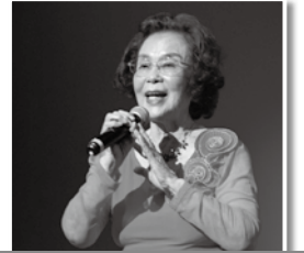
三宅校区 「哀しみのラストタンゴ」