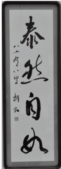
【最高年齢者賞】 泰然自如(書) 原 勝興(88)