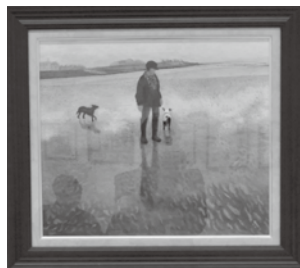
【奨励賞】 サセックスの引き潮(洋画)