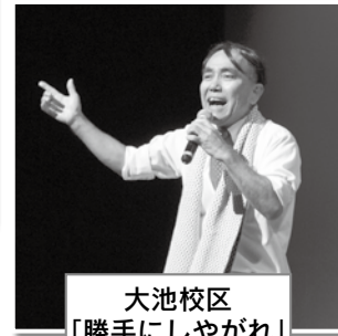
大池校区 「勝手にしやがれ」