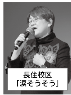
長住校区 「涙そうそう」