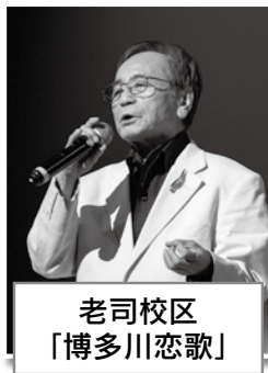
老司校区 「博多川恋歌」