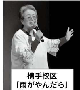
横手校区 「雨がやんだら」