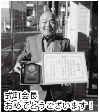
式町会長 おめでとうございます！

今後の展望として、会員減少が課題であり、積極的に会員を増やすための方法を模索しています。みなさんも手探りであるとは思いますが、あきらめず前向きに取り組んでいきましょう。