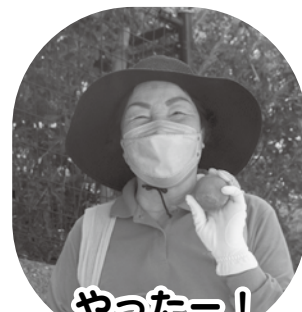
やったー! ホールインワン!