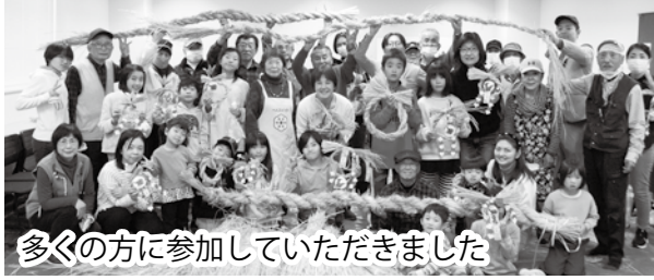
多くの方に参加していただきました

12月9日(土)、南市民センターにて「大しめ縄作りワークショップ」を開催しました。この事業は南市民センターよりしめ縄づくりのイベントをしたいとの相談があり、昨年より共同事業として行っています。昨年は10月から準備を開始したため、わらの材料集めなどで苦労をしましたが、今年からは早期に練習や準備を行い、女性部や盛年部の協力もあり、定数を増や