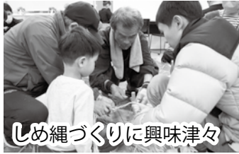
しめ縄づくりに興味津々

して実行することができました。参加された方は、普段買わないことが多いしめ縄を自分でつくることの大変さ、わらや飾付けの準備に奔走された運営への感謝の気持ちを噛み締めておられました。子どもたちも普段体験することの少ないしめ縄づくりに興味津々で、地域のおじいちゃんおばあちゃんとのものづくりを大変楽しんでおりました。