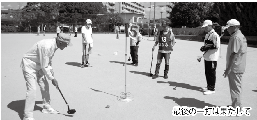
最後の一打は果たして