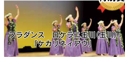
フラダンス ロケラニ玉川(玉川) 「ケカリネイアウ」

上がります。いずれ劣らぬパフォーマーに審査は難航。最優秀に選ばれたのは、一般のトリを飾った東若久校区「若久園三味線」チームの、三味線合奏によるお座敷歌謡メドレーでした。審査員からは「元気がほくほく笑顔でした。つらつな演技が良かった」「最高のパフォーマンスだった！パワーをもらった」などの全体講評もあり、会場は温かい雰囲気にも包まれました。最後に「ちょっと抽選会」を実施して11名の方が当選しました。