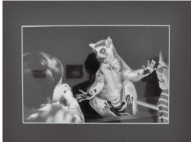
【特別賞 福岡市長賞】 仲良くしようよ(写真) 松本 明子