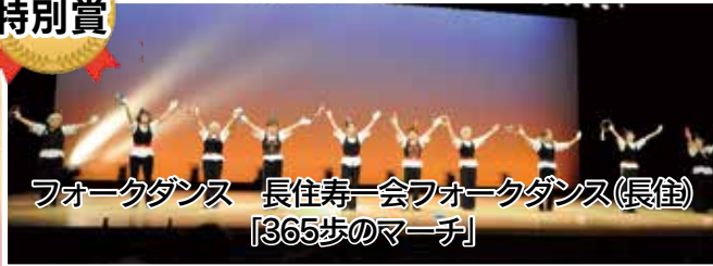
フォークダンス 長住寿一会フォークダンス(長住) 「365歩のマーチ」