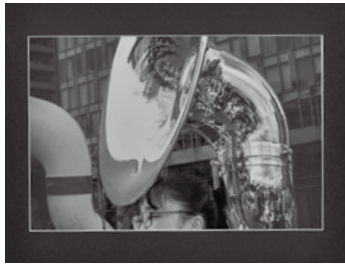
【銀賞】 スーザフォンも賑やかに(写真) 松尾 晃