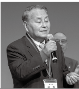
諸熊副会長 「あこがれのハワイ航路」