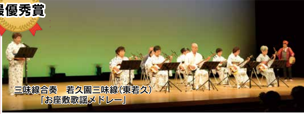
三味線合奏 若久園三味線(東若久) 「お座敷歌謡メドレー」

7月5日(水)、南市民センターホールにて第48回シニア演芸大会を開催しました。一般出演は15組で、ウクレレ演奏あり、三味線合奏ありから手話ダンス、フォークダンス、フラダンス、日本舞踊まで、実に多彩で華やかな舞台でした。来場者からは、実に多彩で華やかな舞台に拍手と歓声が湧き