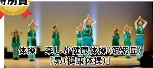
体操 楽しく健康体操(筑紫匠) 「昂(健康体操)」