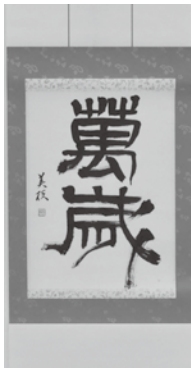
【奨励賞】 万歳(書) 長尾 美枝