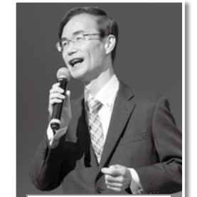
大楠校区 「真っ赤な太陽」