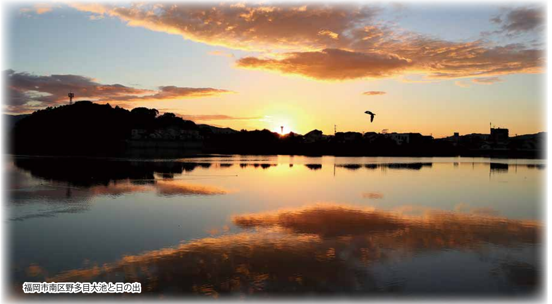
福岡市南区野多目大池と日の出