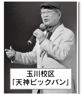
玉川校区 「天神ビックバン」