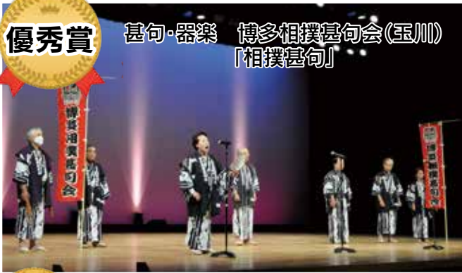
甚句・器楽 博多相撲甚句会(玉川) 「相撲甚句」