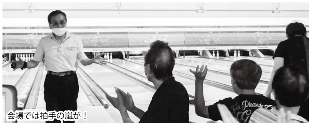
会場では拍手の嵐が!