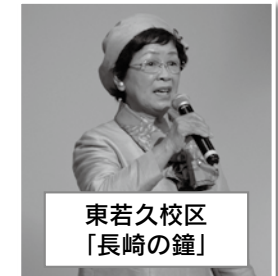
東若久校区 「長崎の鐘」