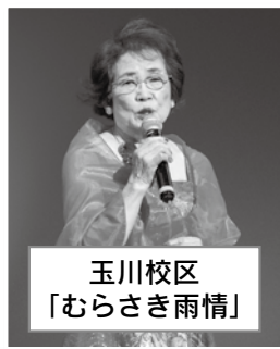
玉川校区 「むらさき雨情」