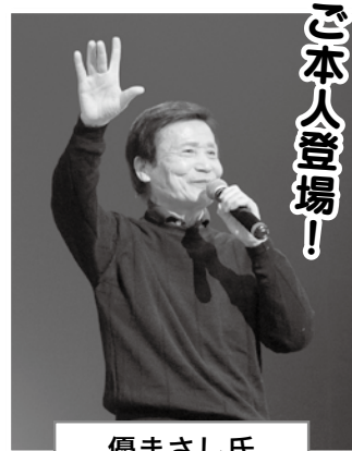
優まさし氏 「天神ビックバン」